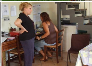
Le Case de Tiedoli Einsatzplanung