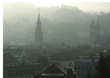
Blick auf St. Gallen Schwarzes Brett

Versorgungsstrukturen für den Fall der Pflegebedürftigkeit sind nicht eingeplant, aber manchmal machen sich die Bewohner ihre eigenen Gedanken dazu. Es gibt ein gutes Beziehungsnetzwerk.