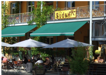
Quartier Vauban Bürgertreffpunkt Süden