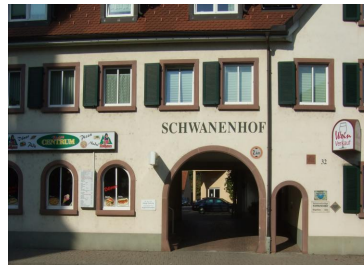
Betreutes Wohnen Schwanenhof Weinlese in Eichstetten

Kernpunkte des Konzeptes waren von Anfang an die Schulung der MitarbeiterInnen, eine gute Einsatzplanung und Fallbesprechungen. Pflege wird durch eine Sozialstation erbracht. Ebenso arbeitet man eng mit Kooperationspartnern zusammen.