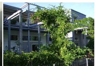
Die Wohnfabrik Solinsieme Hauswirtschaftsraum