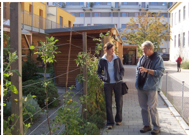
unterschiedliche Baugruppen Projekt Sonnenhof